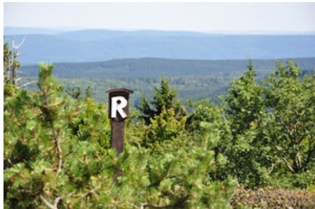
Rennsteig in Thüringen