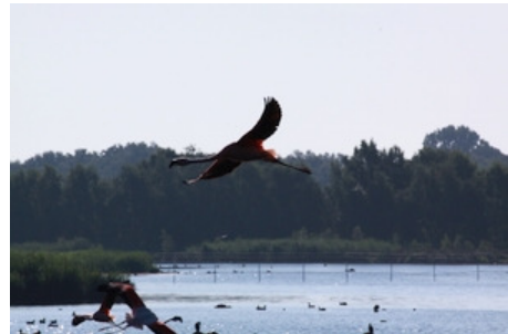
Flamingos im Zwillbrocker Venn

Sa, 12.06.2021, 10:00 Uhr Sa, 19.06.2021, 14:00 Uhr Fr, 09.07.2021, 14:00 Uhr Fr, 16.07.2021, 14:00 Uhr