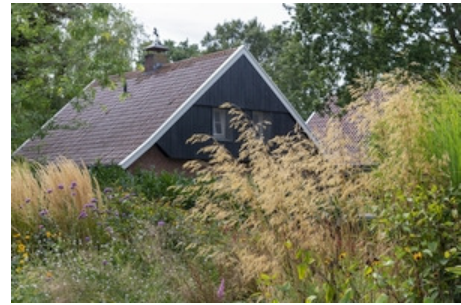
Gärten Twente

auch eine besondere Gärtnerei steuern wir an. Die Staudengärtnerei Fahner liegt am Reiseweg. Ideal also als letzte Station. Wie wir es gewohnt sind, gilt auch diesmal: "de koffie staat klaar!" - hier und da mit einer kleinen Leckerei. Termin: Sa, 04.09.21