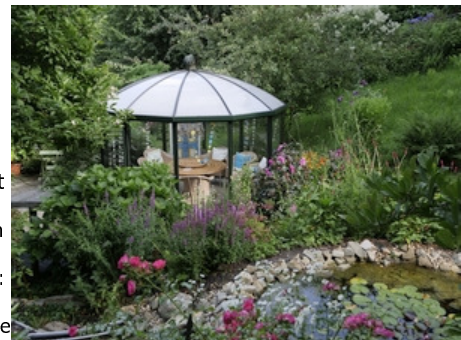
Gärten im Ruhrgebiet