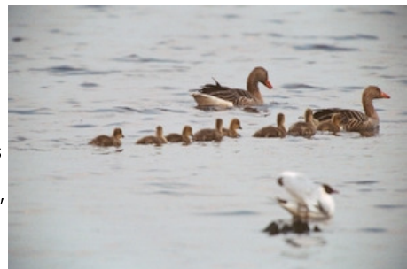
Gänsefamilie im Zwillbrocker Venn