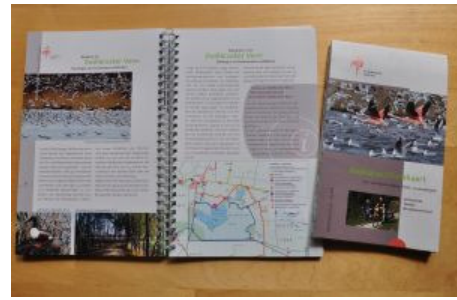
Radwanderführer "Flamingoroute"

Ab 2021 auf dem Knotenpunktsystem grenzenlos radeln: Die Flamingoroute verlief bisher auf deutscher Seite auf dem Radverkehrsnetz NRW und in den Niederlanden über das Knotenpunktsystem des Fietsenroutennetzworke. Mit der Neuauflage des Rad- und Wanderführers Flamingoroute verläuft die Route sowohl auf deutscher als auch auf niederländischer Seite über das Knotenpunktnetz für Radfahrer.