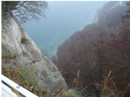
Rügen im Herbst