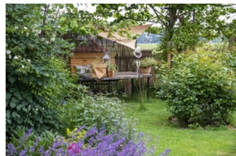
Gärten im Münsterland